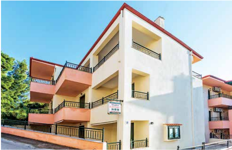
XENIOS STUDIO ELISSAVET